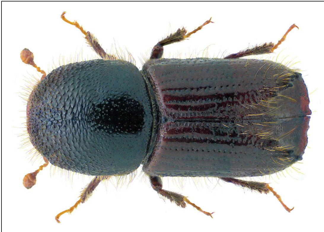
Obr. č.1: Lýkožrout smrkový ( Ips typographus L.)